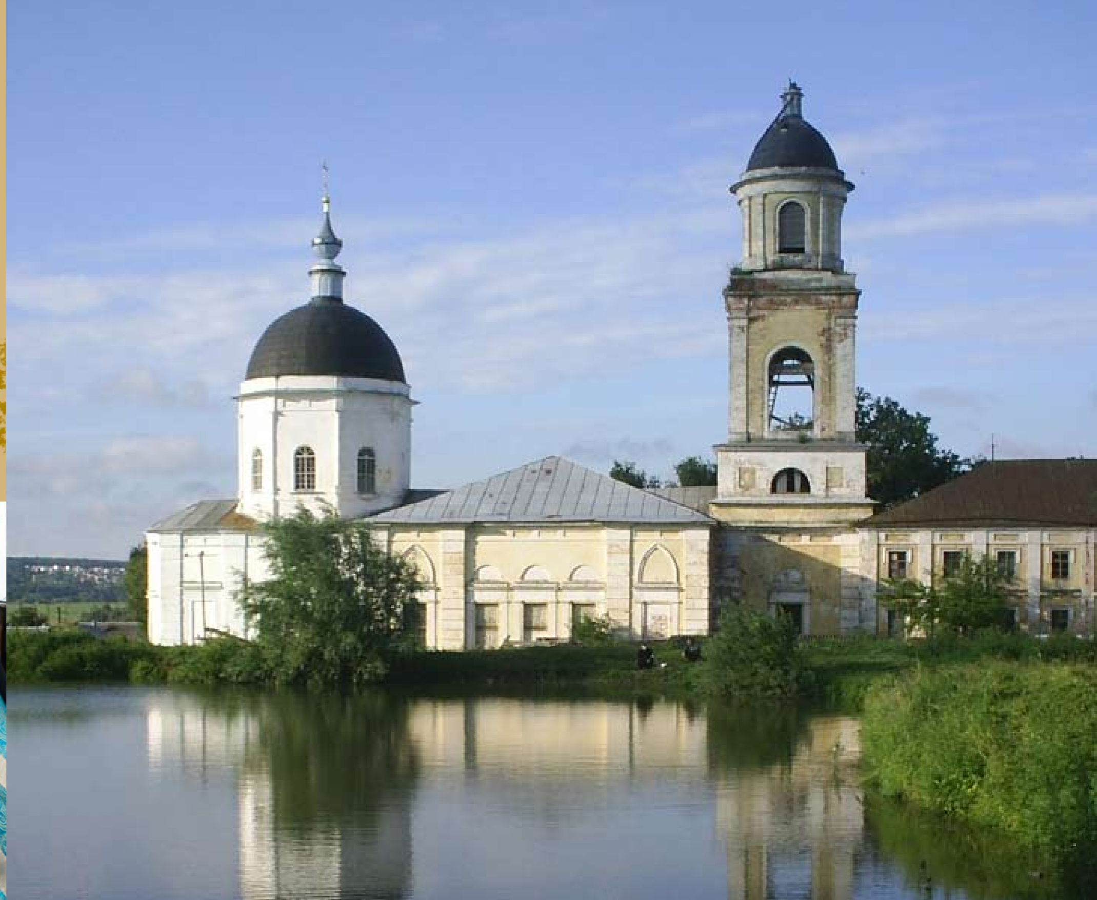
Фото 4. Вид храма в 30-е годы XX века.

К сожалению, на помощь государства надеяться не приходится, так как, несмотря на свою историческую ценность, на реставрацию этого храма средства из бюджета не выделяются. Восстановление храма можно выполнить, только опираясь на помощь прихожан и добровольные пожертвования организаций.