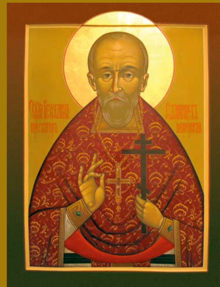
Фото 3. Священномученик Вениамин Ступинский и Мещеринский

В центральном объеме храма были сделаны новые железобетонные перекрытия. В новых помещениях разместились библиотека и гардеробная, а в трапезной части устроены киноаппаратная, зри-